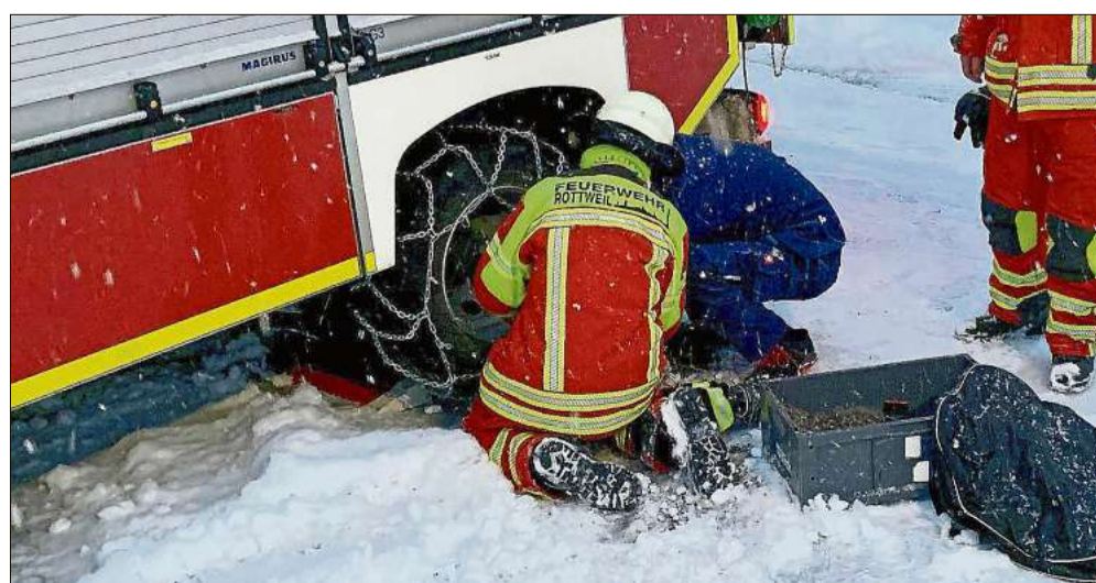
Ohne Schneeketten geht im Einsatz fast nichts mehr.

Bis zum Nachmittag des Samstags hatte die Feuerwehr Rottweil damit im Jahr 2021 bereits 31 Einsätze zu bewältigen.