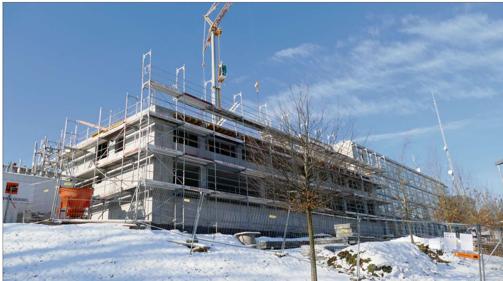
Der Erweiterungsbau entlang der Kaiserstraße in Rottweil schafft für die erweiterte Kriminalpolizeidirektion zusätzlichen Platz von 4100 Quadratmetern.