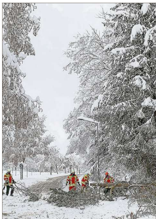
Viele Bäume brechen unter der Schneelast zusammen. Die Feuerwehr beseitigt die Gefahr.